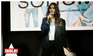
La modelo Blanca Padilla viajó desde Nueva York para mostrar su apoyo a SOHUMAN.

La plataforma de moda sostenible y solidaria logra esta distinción en el marco de la final de la 14ª edición de los 'Premios Jóvenes mashumano', un acto en el que, además, contó con el apoyo de la modelo Blanca Padilla