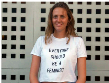
Una joven con una camiseta feminista, en el barrio madrileño de Tetuán. Foto de archivo. // Camila Tovar (EL PERIÓDICO)

Descubrimos qué y quién hay detrás de los productos solidarios que llevan los famosos y encontramos en redes sociales