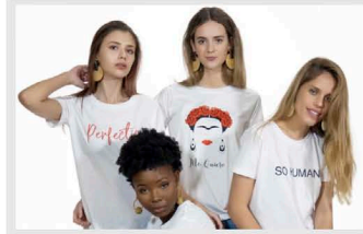
Sohuman @ Showroom Ego 2020

Las camisetas de la firma Sohuman son conocidas por estar consiguiendo concienciar a la gente de que es posible la moda sostenible con campañas solidarias. Y como quieren seguir expandiendo esa idea, sus diseños estarán en el showroom de EGO. Su principal misión es hacer ropa que dure en el tiempo y mostrar transparencia en los precios finales. Una